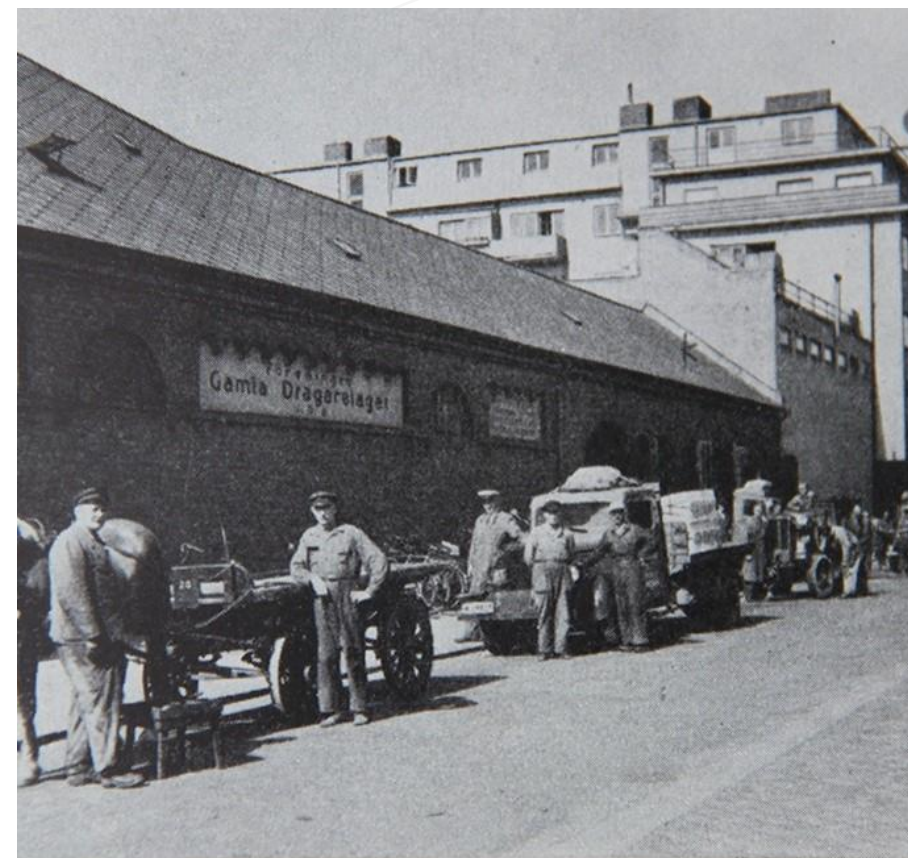
Gamla Dragarelagets garage- och stallbyggnad i Kalifo